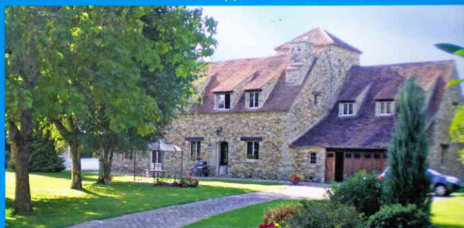
▲ Propriété en Seine-et-Marne