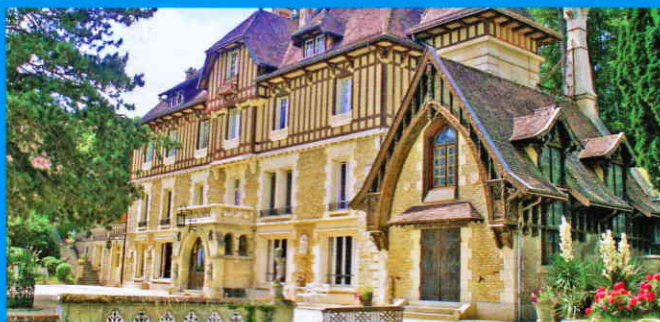
▲ Manoir dans l'Oise

Édition internationale - Imprime en France