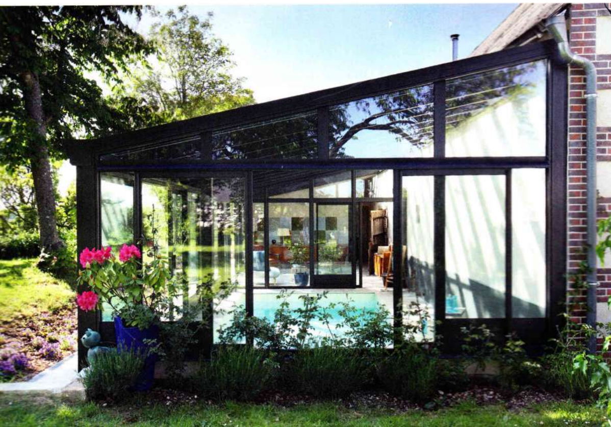
^ Véranda de style victorien TURPIN-LONGUEVILLE